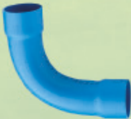
Curva 90° Conformado (Cementar) Ø 63mm a 250mm