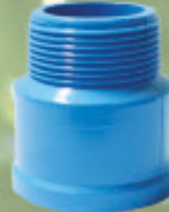
Terminal He Inyectado Ø 20 x 1/2" a 110 x 4"