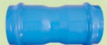
Copla Unión Conformado (ANGER) Ø 63mm a 250mm