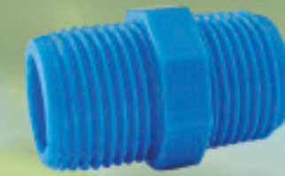
Niple He-He Inyectado Ø 1/2" a 4"