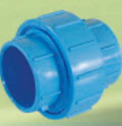
Unión Americana Inyectado Ø 20mm a 110mm