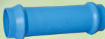
Copla Reparación Conformado (ANGER) Ø 63mm a 250mm