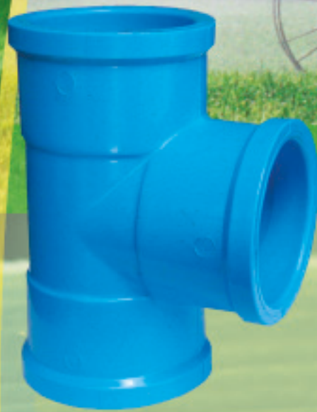
Tee Inyectado Ø 20 mm a 315 mm