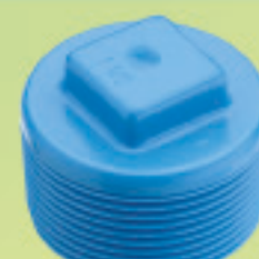
Tapa tornillo HE Inyectado Ø 1/2" a 2"