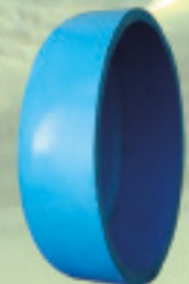
Tapón Conformado (Cementar) Ø 63mm a 250mm