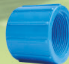
Copla HI-HI Inyectado Ø 1/2" a 2"