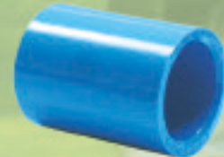
Copla Inyectado Ø 20mm a 315mm