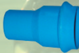
Reducción Larga Conformado (ANGER) Ø 63x50mm a 250x200mm