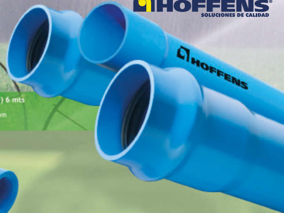
Tubería Presión c/goma y cementar(*) 6 mts 20mm* / 25mm* / 32mm* / 40mm* / 50mm* 63mm / 75mm / 90mm / 110mm / 125mm / 140mm 160mm / 200mm / 250mm / 315mm