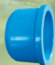
Tapa gorro Inyectado Ø 20mm a 250mm