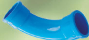
Curva 45° Inyectado 20mm a 50mm