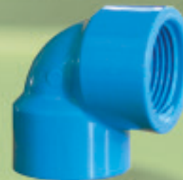
Codo HI 90° Inyectado Ø 20x1/2" a 25x3/4"