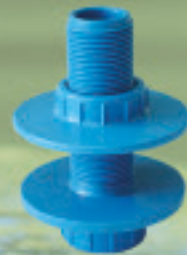
Salida estanque Inyectado Ø 20 x 1/2" a 63 x 2"