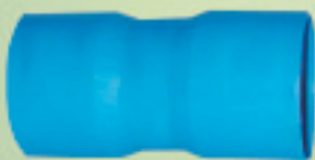
Copla Unión Conformado (Cementar) Ø 63mm a 250mm