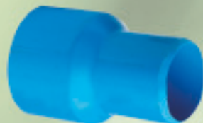
Reducción Larga Conformado (Cementar) Ø 63x40mm a 250x200mm