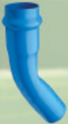
Curva 22,5° Conformado (ANGER) Ø 63mm a 250mm