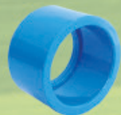
Buje corto Inyectado Ø 25x20mm a 315x250mm