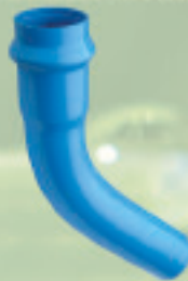
Curva 45° Conformado (ANGER) Ø 63mm a 250mm