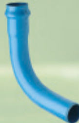
Curva 90° Conformado (ANGER) Ø 63mm a 250mm