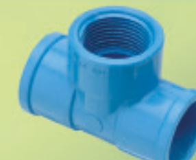
Tee HI Inyectado Ø 20mmx1/2" a 25mmx3/4"