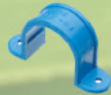
Abrazadera Inyectado Ø 20mm a 25mm