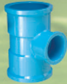
Tee Reducción Inyectado Ø 25x20mm a 160x140mm