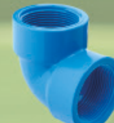
Codo HI-HI 90° Inyectado 1/2" a 2"