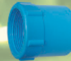
Terminal HI Inyectado Ø 20 x 1/2" a 110 x 4"