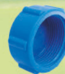
Tapa gorro HI Inyectado 1/2" a 4"