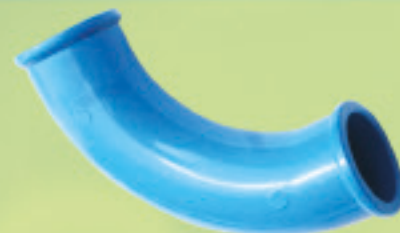
Curva 90° Inyectado 20mm a 50mm