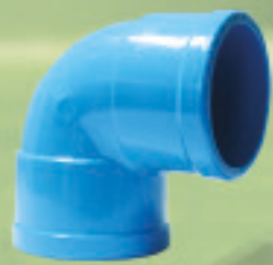
Codo 90° Inyectado Ø 20mm a 315mm