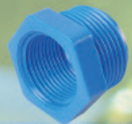
Buje reducción He-HI Presión (bushing) Inyectado Ø 3/4"x1/2" a 4"x3"