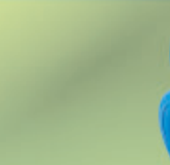
Tee HI-HI Inyectado Ø 1/2"x1/2" a 2"x2"