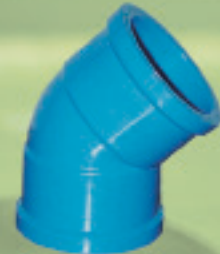
Codo 45° Inyectado Ø 20 mm a 315mm