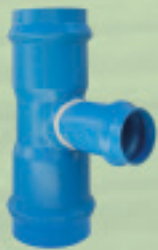
Tee reducción c/anillo Conformado (ANGER) Ø 75x63mm a 200x160mm