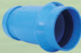
Tapón c/anillo Conformado (ANGER) Ø 63mm a 250mm