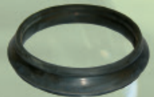
Anillo de goma ANGER Ø 63mm a 315mm