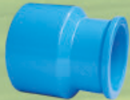
Buje reducción largo Inyectado Ø 25x20mm a 110x75mm