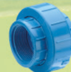
Unión Americana HI-HI Inyectado Ø 1/2" a 2"